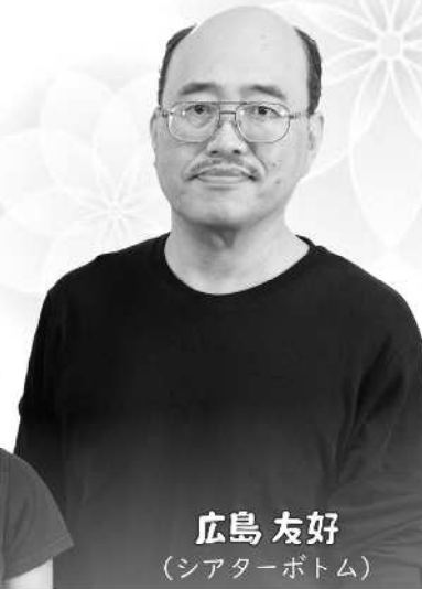
広島 友好 (シアターボトム)